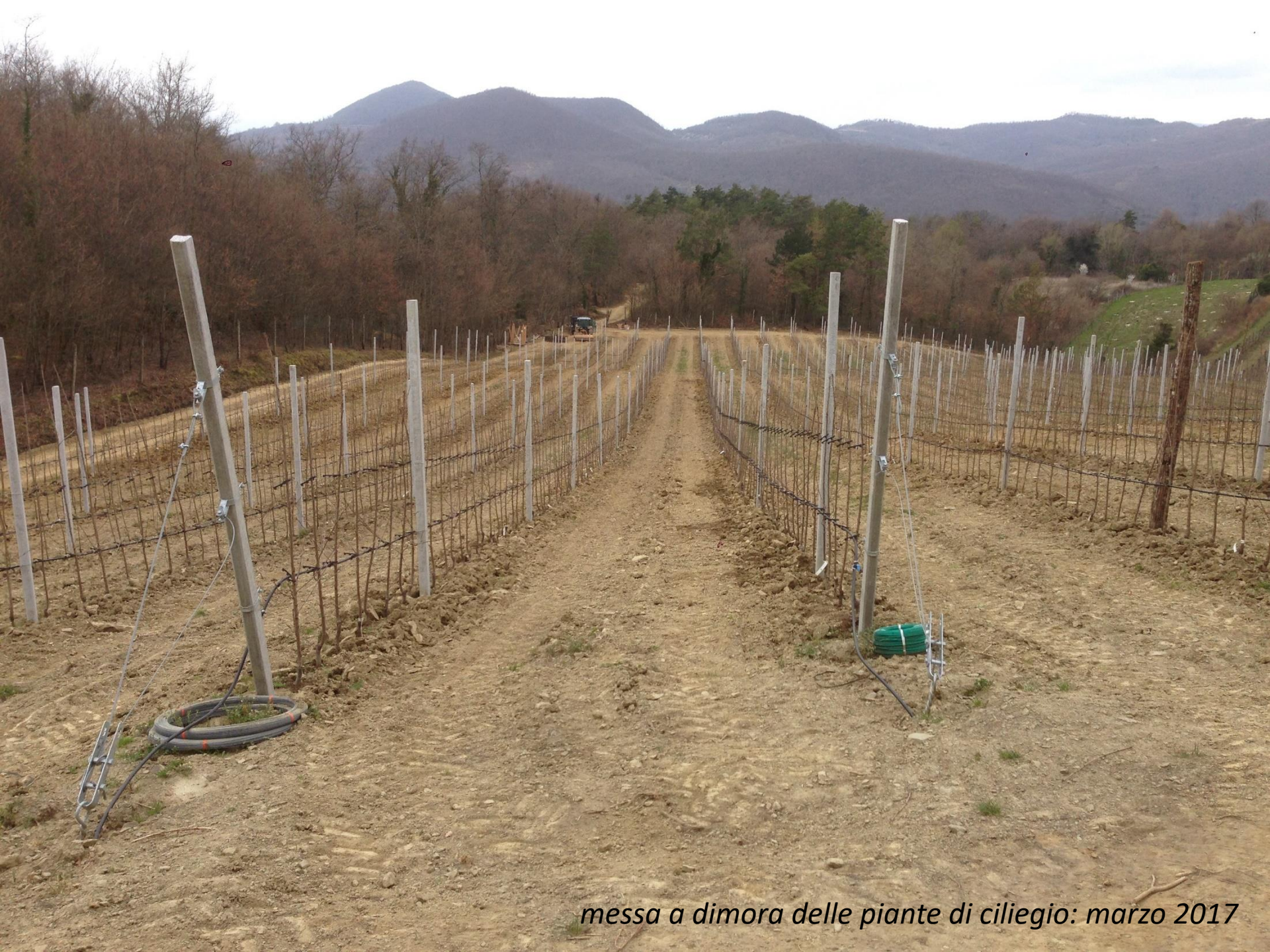
messa a dimora delle piante di ciliegio: marzo 2017