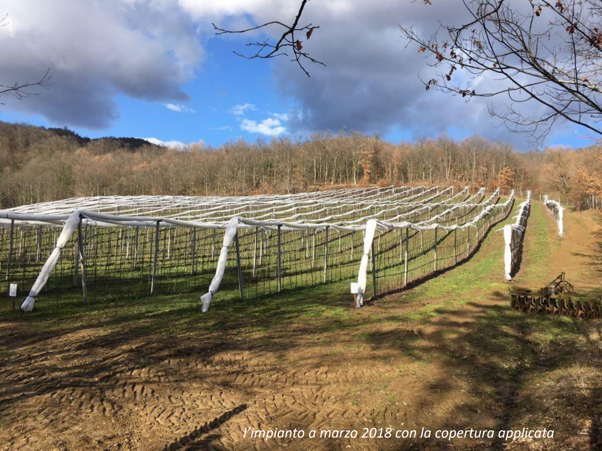
l'impianto a marzo 2018 con la copertura applicata