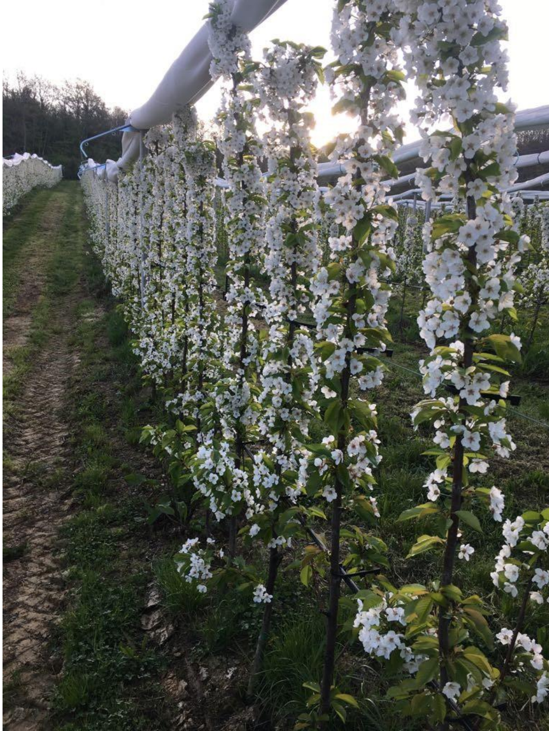
la fioritura ad aprile 2018