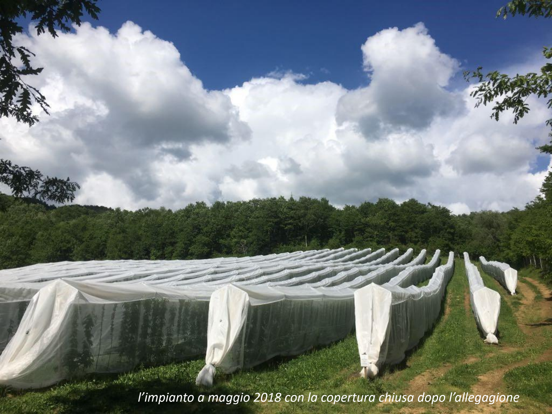
l'impianto a maggio 2018 con la copertura chiusa dopo l'allegagione